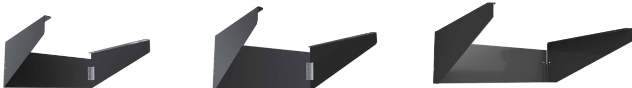
A17-RHS-S (hasta 150W)