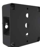
Montura de pared A17-WM