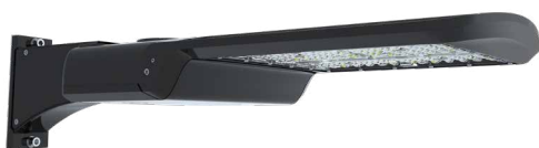
Viene con montura universal para poste

Con varias opciones de montura disponibles, el A17 puede usarse en distintas áreas para lograr un estilo unificado: Estacionamientos, Fachadas de edificios, caminerías adyacentes, etc.