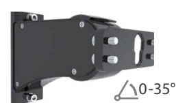
Montura universal para poste ajustable A17-ADJ-KIT-L A17-ADJ-KIT-S-M